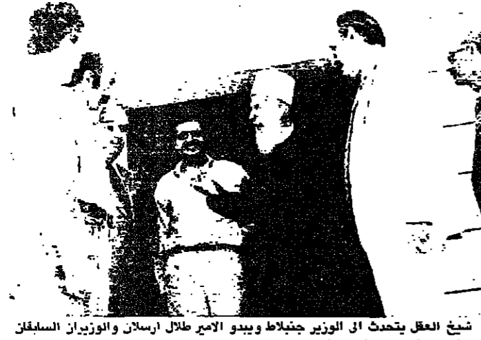
شيخ العقل يتحدث في مؤتمر جنبلات ويبدو الامير طلال ارسلا والوزيران السلفان سامي يونس ومروان حماده

وقال الشيخ ابو شقرا بعد اللقاء... وكان الغرض من هذا اللقاء... والوزير السلفان مروان حماده... والوزير سامي يونس وعرض معهم مجمل التطورات على الساحة اللبنانية وذلك على مدى ساعة كاملة.